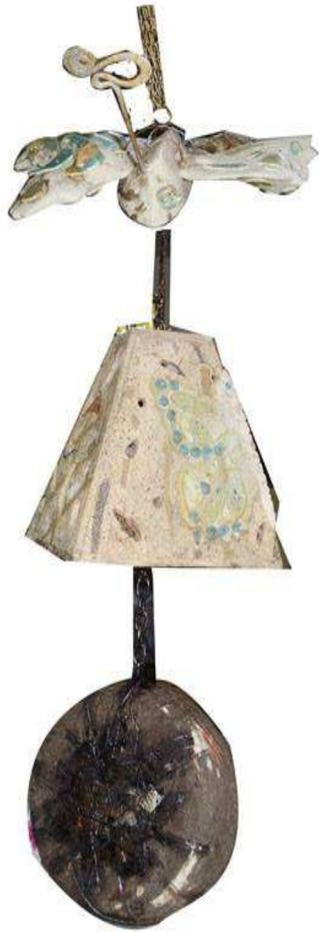
“Las Edades de dANIELA“